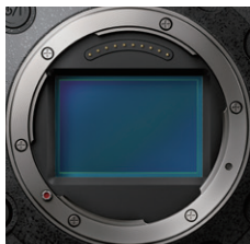
※画像はAW-UB50のものです。

AW-UB50は24.2Mフルサイズ MOSセンサー、AW-UB10は4/3型10.3M MOSセンサーを採用。優れた色再現と解像感で高品位な映像を撮影でき、高感度大判センサーを生かした浅い被写界深度により、背景が美しくボケた情緒的な表現を実現します。また、AW-UB50は14+ストップAW-UB10は13ストップの広ダイナミックレンジを持ち、低照度下でもきめ細かな描写が可能です。